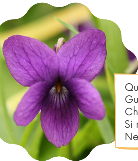
Violetta ( Viola odorata )

Questo fiore, invece, fiorisce tra marzo e aprile. Guarda che forma strana!