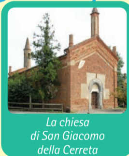
La chiesa di San Giacomo della Cerreta