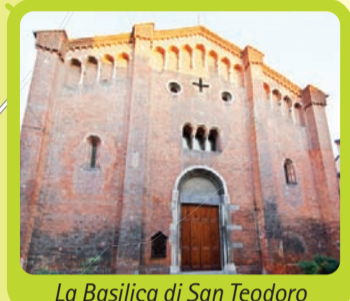
La Basilica di San Teodoro