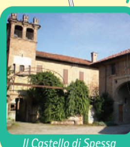
Il Castello di Spessa