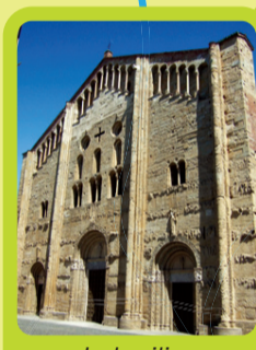
La basilica di San Michele Maggiore