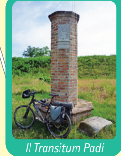
Il Transiùm Padi

La Via Francigena in provincia di Pavia finisce alla frazione Lambrinia di Chignolo Po, per proseguire in provincia di Lodi a Corte Sant'Andrea, frazione di Senna Lodigiana, da dove si verrà traghettati sull'altra sponda del Po. Le prenotazioni del traghetto al numero 0523.771607 dalle ore 20 del giorno prima dell'imbarco.