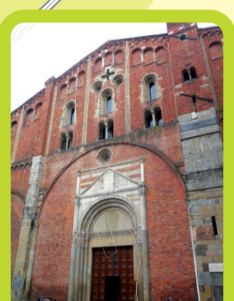
La basilica di San Pietro in Ciel d'Oro