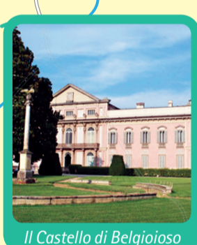
Il Castello di Belgioioso