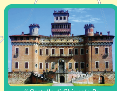
Il Castello di Chignolo Po