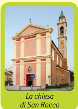
La chiesa di San Rocco