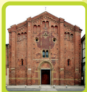
La chiesa di Santa Maria in Betlem