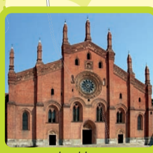
La chiesa di Santa Maria del Carmine